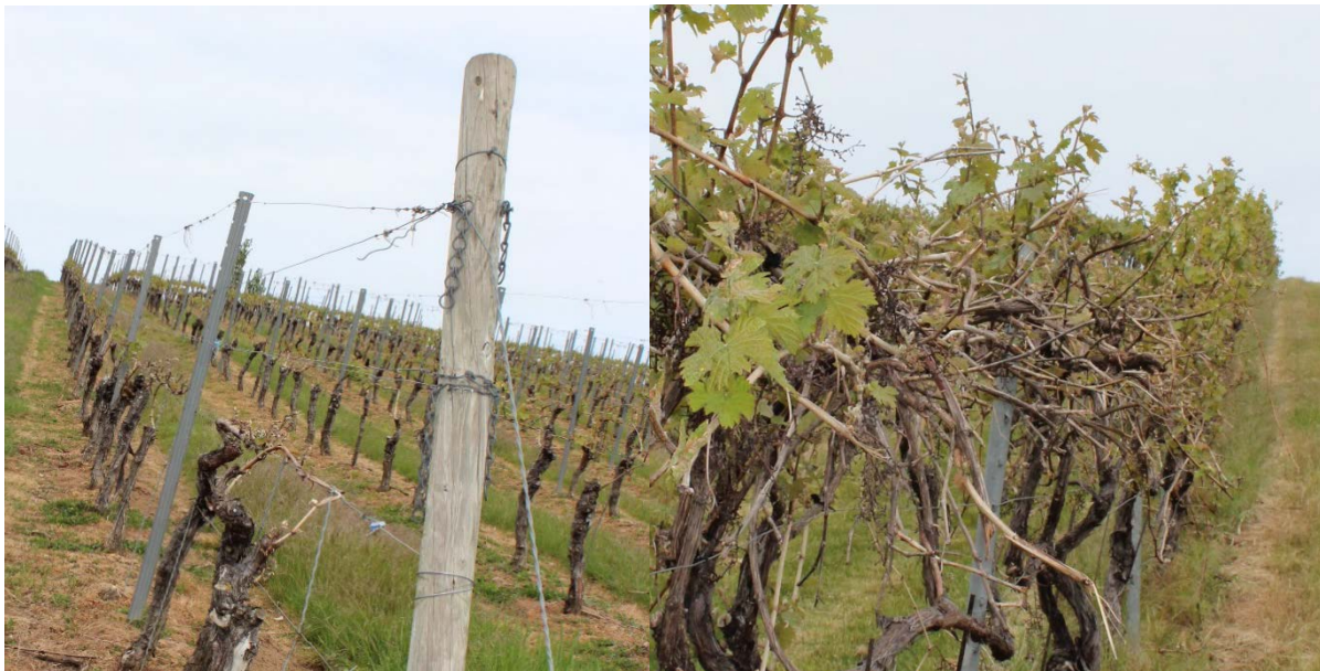
Abbildung 8: r. Spaliererziehung mit Flachbogen, l. klassischer Minimalschnitt, Dornfelder, Naumburger Paradies, 19.05.2020, 4 Tage nach Spätfrostereignis

So zeigte auch das Spätfrostereignis vom 15.05.2020 in mittelbar benachbarten Rebanlagen unterschiedliche Ausprägungen der Frostschädigung. Im klassischen Minimalschnitt waren nur geringfügige Treiberfrierungen festzustellen, während in der angrenzenden Spaliererziehung mit Bogrebe in Teilbereichen ein 100% Verlust zu beobachten war. Die in der Folgezeit ausgetriebenen Beiaugen zeigen sich weitestgehend unfertil, so dass kein nennenswerter Ertrag zu erwarten ist (Abbildung 8) bzw. eine durch die verzögerte Rebenentwicklung eine zeitlich versetzte Teillese notwendig werden wird. Die geschädigten Teilbereiche in der Erziehungsform Minimalschnitt im Spalier kompensieren über die hohe Zahl der ausgetriebenen Beiaugen die Schädigung.