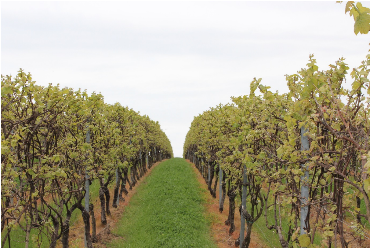
Abbildung 1 Minimalschnitt im Spalier, Naumburger Pardies, 02.05.2018

Die veränderte Laubwandstrukturen und Entwicklungsverlauf bedingen auch angepasste Anforderungen in der Bewirtschaftung.