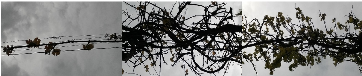
Abbildung 6: Aufnahmen für Bestimmung Leaf area index via App VityCanopy [ \text{m}^2 Laubfläche/ \text{m}^2 Grundfläche]; Versuchsanlage, 2.5.2018; v.l. Bogrebe (Dornfelder), LAI 0,146; MPS klassisch (Dornfelder) LAI 1,289; MPS Spalier (Müller-Thurgau) LAI 1,091

Die Oidium-Infektionen waren am stärksten ausgeprägt in der Gipfelzone im MPS Spalier und in der oberen Laubwandhälfte beim klassischen MPS. In diesen Bereichen sind die „Laubwandhecken“ am stärksten verdichtet, gleichzeitig haben verschiedene PS-Geräte gerade in diesem Bereich Defizite in der Luftstromgeometrie und damit bei der Applikationsqualität.