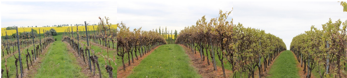
Abbildung 4: Austrieb v.r Flachbogen mit Wintererbschnitt, Minimalschnitt klassisch, Minimalschnitt Spalier, Standort Naumburger Paradies, 2.5.2018

Grundsätzlich ist bei der Neuanlage bzw. der Umstellung von Bestandanlagen zum Minimalschnitt dem hohen Mechanisierungsgrad und der stärkeren Belastung der Drahtrahmenanlage durch die Laubwand/ Hecke Rechnung zu tragen. Empfehlenswert sind reichlich bemessene Reihenabstände bei durchschnittlichen Laubwanddicken im Minimalschnitt im Spalier von 0,5 m, ebenso ein robuster Drahtrahmen mit verkürzten Stickleabständen, ausreichend verstärkten Endverankerungen und höhere Drahtstärken. Ebenso sollten zur zeitlichen Optimierung der Bewirtschaftungsgänge die Vorgehende an entsprechende Maschinen und Maschinenkombinationen angepasst werden. Nachbesserungen in bestehenden Anlagen erwiesen sich bei den hohen Laubwandgewichten und im Drahtrahmen verbleibenden Altholz als problematisch und nur unzureichend realisierbar, schräg stehende Reihen erschweren die Bewirtschaftung/ Vollernterlese und beeinflussen die Laubwandstruktur und damit die Applikationsqualitäten der Pflanzenschutzmaßnahmen.