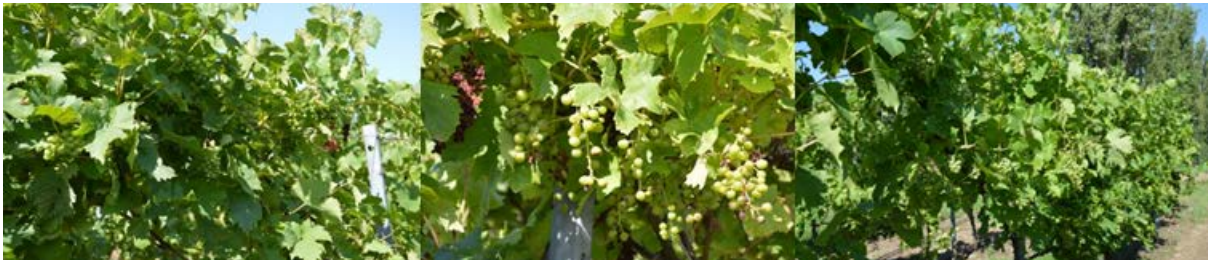
Abbildung 5: Ertragsregulierung MPS Spalier mit Vollernter, Naumburger Paradies, v.l. Variante ausgedünnt, Eintrocknung und Beschädigungen nach Vollernterausdünnung, Variante ohne Ausdünnung, 2018

Als Folge des Unterlassens der frühen Ertragsregulierung durch Winterschnitt tragen die Reben zunächst eine hohe Anzahl von Trauben, was im Jahresverlauf durch Selbstregulation des Stockes und dem Ausbilden kleinerer Einzelbeeren kompensiert wird. Dennoch kann zur Ertragsregulierung und Absicherung der Basisqualitäten im Minimalschnitt Spalier eine Ausdünnung mit Vollernter zum Entwicklungsstadium Erbsengröße notwendig werden. Wie auch in der Literatur diskutiert zeigte sich, dass keine allgemeingültigen Angaben zu Schlagzahl und Fahrgeschwindigkeit gemacht werden können. Eine Feinjustierung in Abhängigkeit von Behang, Entwicklungszustand/ Vitalität und Ertragswartungen ist individuell vorzunehmen. Die Erfolgsrate wurde erst nach vollständigem Eintrocknen der Beschädigungen einschätzbar, als Schockreaktion auf den Eingriff konnten wir eine Verzögerung der Beerenentwicklung beobachten. Alternativen zur Ertragsreduzierung wie der Einsatz von Wachstumshormonen zur Blüte oder der gezielte Einsatz von Pflanzenschutzmitteln bzw. Pflanzenschutzmaßnahmen in die Blüte zur Steigerung der Verrieselung zeigten keine belegbaren Auswirkungen auf die Ertragsbildung bzw. erscheinen wenig steuerbar. Aufgrund der spezifischen Laubwandstruktur (Beschattung innerhalb Laubwand, höhere Belichtung in oberer Laubwandzone und Gipfelzone, Entwicklungsförderung durch apikale Dominanz) ist die Blüte stark „verzettelt“ und damit der Zeitpunkt der Applikation nur auf Teilbereiche abgestimmt.