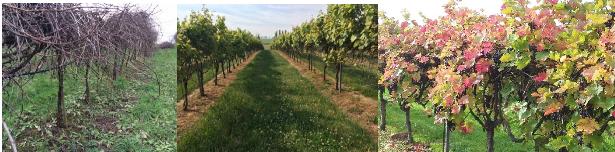
Abbildung 7: Klassischer Minimalschnitt Dornfelder, Standort Naumburger Paradies, v.l. vor maschinellem Winterkorrekturschnitt, Frühsommer, vor Ernte

Verschiedene Tastversuche zum Zurücksetzen der Verkahlungen durch unterschiedliche Eingriffe und Regulierungsintensitäten laufen. Im klassischen Minimalschnitt werden unterschiedliche Intensitäten beim maschinellen Rückschnitt und durch gezielten manuellen Winterschnitt geprüft. Ein hohe Eingriffsintensität durch den Einsatz eines Vorschneiders (Rückschnitt unter oberem Heftdrahtpaar) und der manuelle Rückschnitt auf Altholz aus dem Umstellungsjahr (Belassen von 4-5 vertikalen Altholzarmen) wurden im System Minimalschnitt im Spalier angewendet.